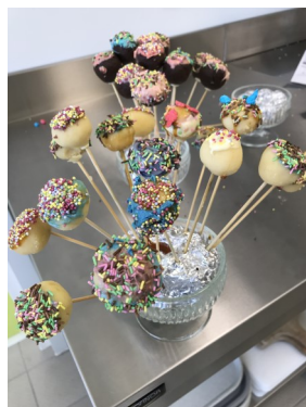
FABRICATION DE CAKE-POPS AVEC LES 3 o 5