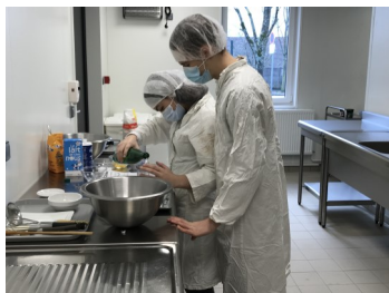
RÉALISATION D'UN DESSERT DANS L'ATELIER HAS AVEC LES 3 o 5

Au sein du collège, l'équipe de la SEGPA assume une responsabilité de formation à visée professionnelle à l'égard des élèves en difficultés qu'elle accueille. Le projet individuel de l'élève se construit progressivement au cours de son cursus en Segpa, en accord avec ses goûts, ses capacités, ses stages effectués et les offres de formation du bassin de Nancy-Pont-à-Mousson.