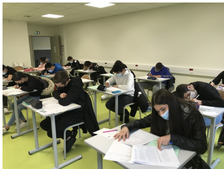
VALIDATION DU SOCLE COMMUN AVE LA CLASSE DE 3 ES MARS 2021